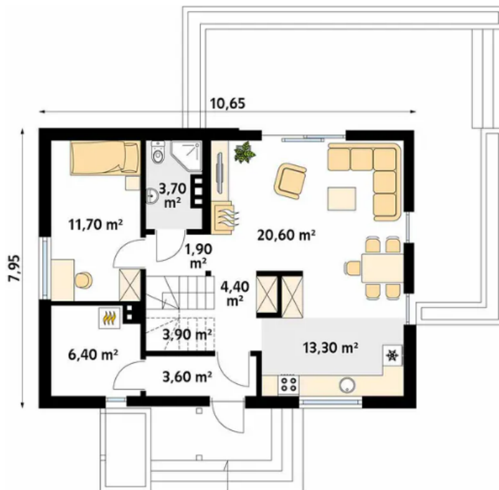
Rzut parteru - 69,60 m 2